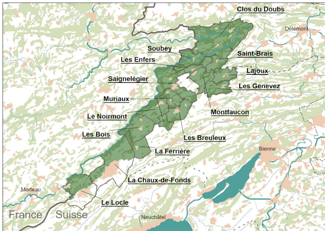
Nouveau périmètre du Parc naturel régional du Doubs, depuis le 1 er janvier 2023, avec le nom et la situation des communes membres. Données : Office fédéral de topographie swisstopo.

L'ambition du Parc du Doubs est de contribuer au développement et au rayonnement de l'ensemble de son territoire, par-delà les frontières communales et cantonales. Les projets sont ainsi pensés pour être aussi transversaux que possible et accessibles à toutes les communes. Le tableau ci-dessous énumère les communes concernées par les différentes activités du Parc.