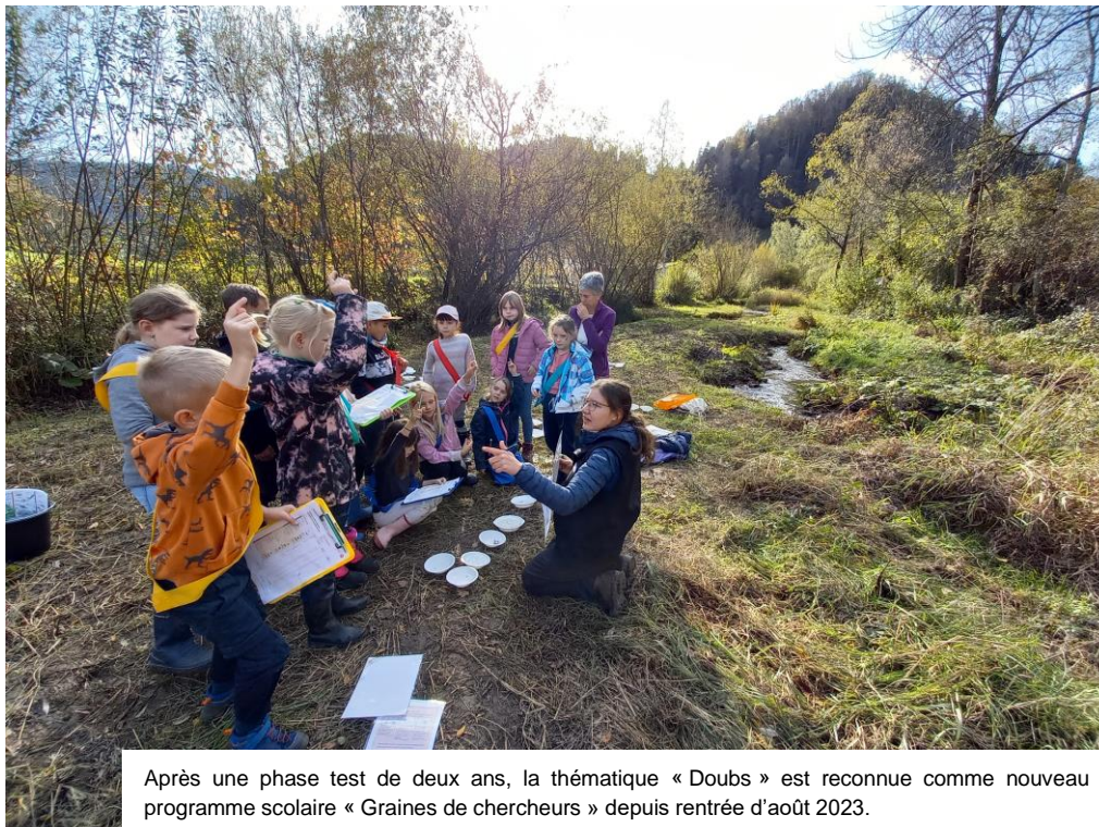
Après une phase test de deux ans, la thématique « Doubs » est reconnue comme nouveau programme scolaire « Graines de chercheurs » depuis rentrée d'août 2023.