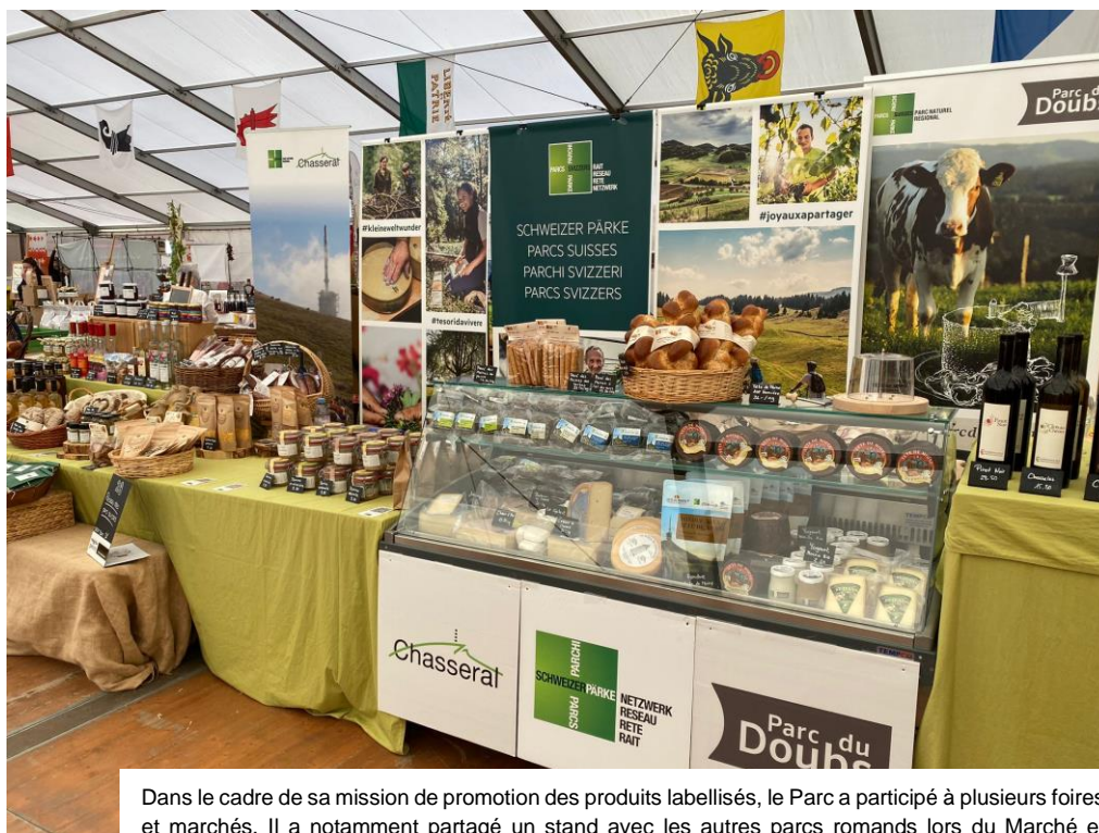
Dans le cadre de sa mission de promotion des produits labellisés, le Parc a participé à plusieurs foires et marchés. Il a notamment partagé un stand avec les autres parcs romands lors du Marché et Concours suisses des produits du terroir à Courtemelon les 23 et 24 septembre 2023.