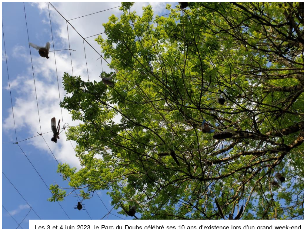
Les 3 et 4 juin 2023, le Parc du Doubs célébrait ses 10 ans d'existence lors d'un grand week-end festif durant lequel le public a pu réaliser un œuvre landart géante et collective.

Le cadre stratégique dans lequel fonctionne le Parc du Doubs est établi dans la Charte courant de 2023 à 2032. La validation de celle-ci par la Confédération permet au Parc de bénéficier du label « Parc d'importance nationale ». La Charte comprend notamment les objectifs stratégiques que s'est fixés le Parc. Les activités et projets menés par le Parc du Doubs sont quant à eux définis dans le cadre des « conventions programmes » signées entre le canton du Jura (canton pilote) et la Confédération (Office fédéral de l'environnement). Celles-ci détaillent les projets et actions concrètes que mène le Parc pour remplir ses objectifs et missions en faveur du développement durable. Les points forts de la convention-programme du Parc naturel régional du Doubs durant l'année 2023 ont été les suivants :