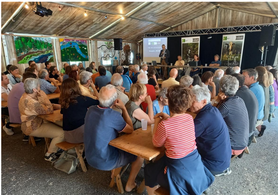
Le Parc du Doubs a tenu son assemblée générale durant le week-end festif marquant ses 10 ans d'existence, le 3 juin 2023 aux Cerlatez.