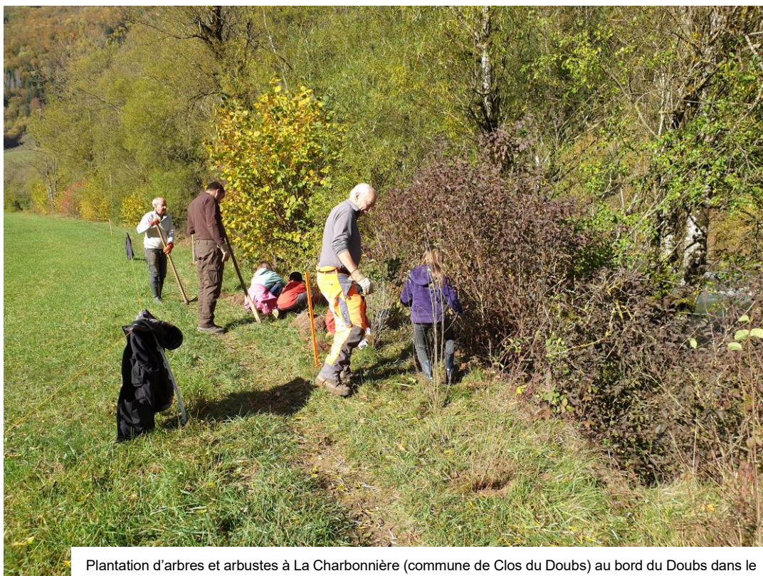
Plantation d'arbres et arbustes à La Charbonnière (commune de Clos du Doubs) au bord du Doubs dans le cadre de la mise en œuvre du Périmètre Réserve aux Eaux.